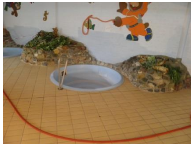
Voor behandeling: 3,9 Na behandeling: 7