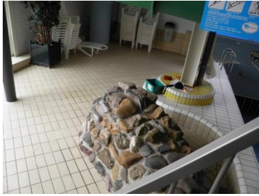
Voor behandeling: 4,2 Na behandeling: 8,6