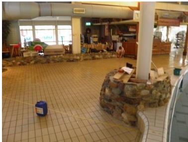
Voor behandeling: 4,1 Na behandeling: 8,3