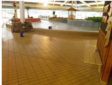
Voor behandeling: 5,0 Na behandeling: 8,3